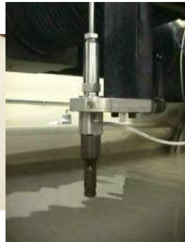
Ένα τυπικό ακροφύσιο waterjet